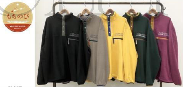
もちのび KRIF MAYER